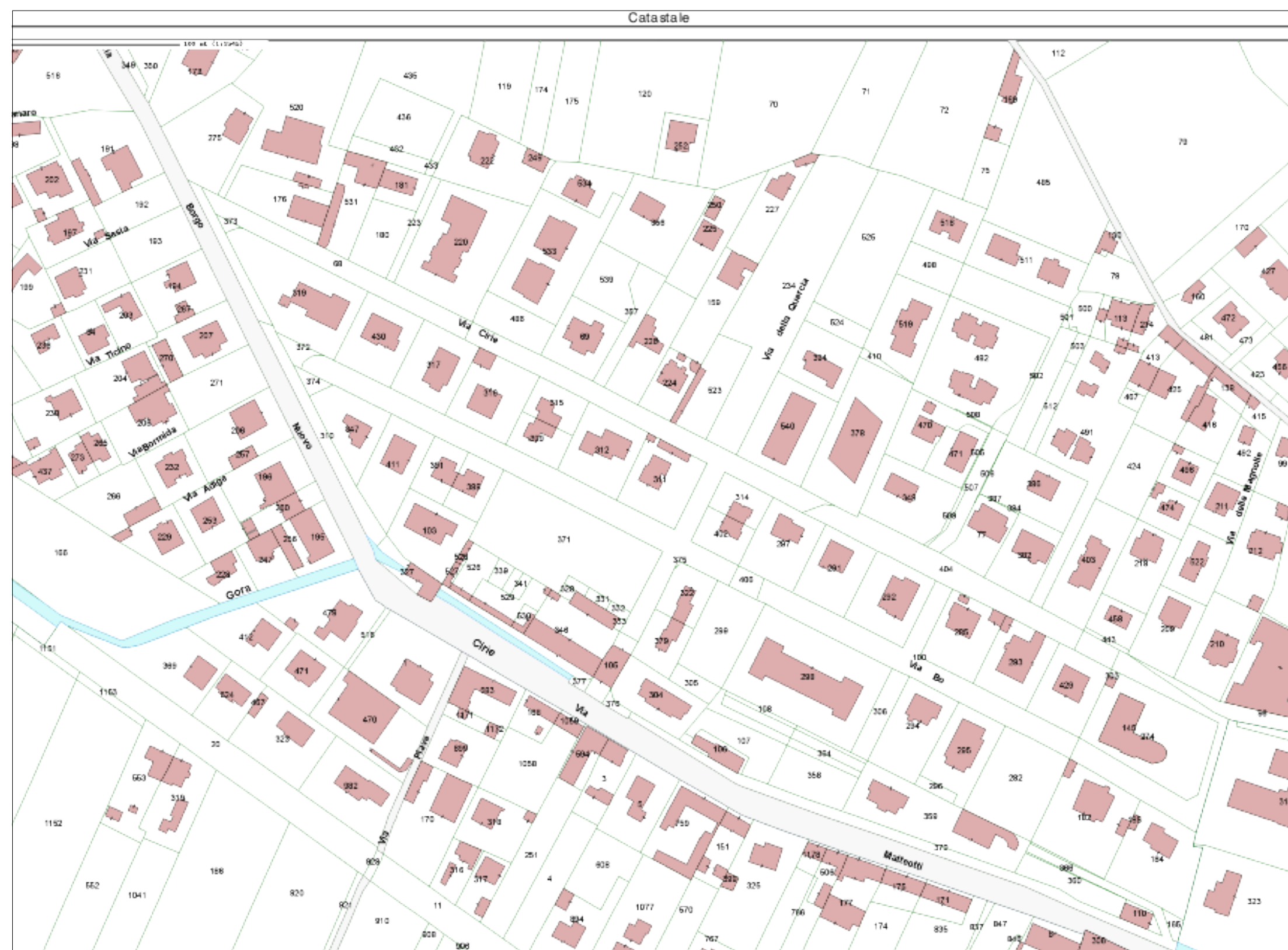
Planimetria Catastale scala 1:2000