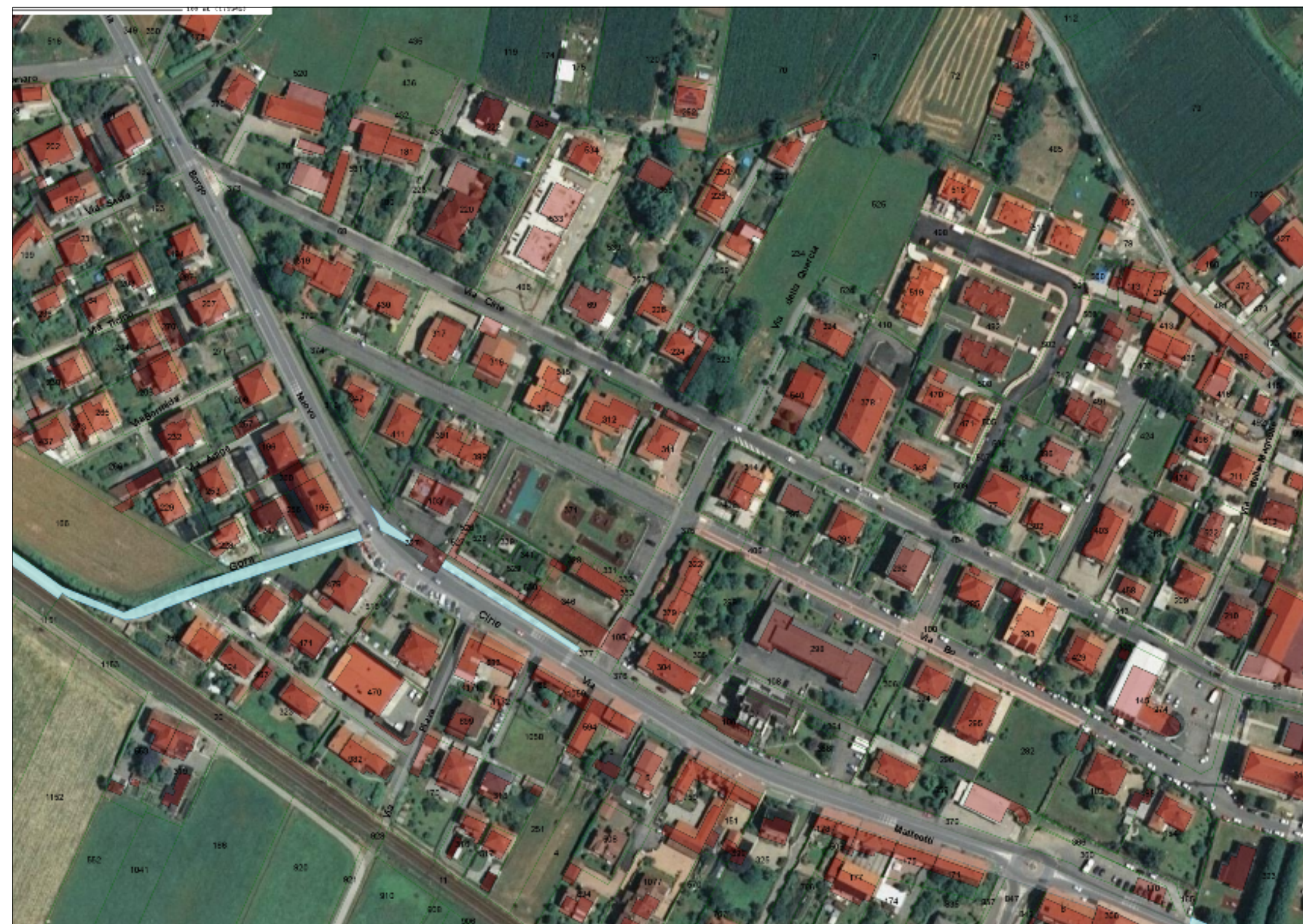
Ortofoto con sovrapposizione di Planimetria Catastale scala 1:2000